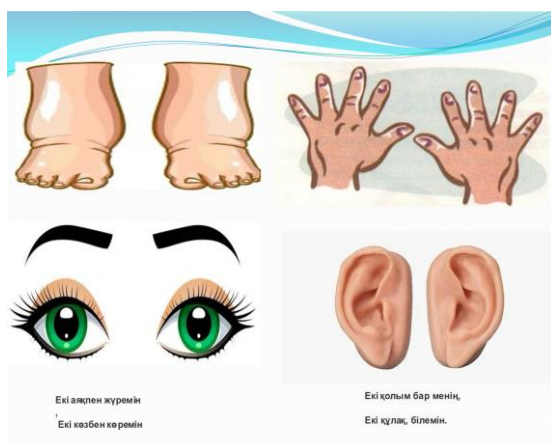
Сурет 3. Мнемокесте технологиясы